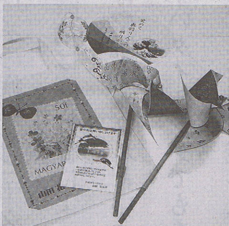
移動教室「パリぼう」では、パソコンやタブレット端末で描いた絵を使い様々なものを作る

ながらも笑顔だ。同市内の女性(79)は、「ネットで何でも調べられるし、ネットショップで買えば玄関まで届けてくれて助かる」。福岡県柳川市の女性(77)は、「自分のiPadを買って